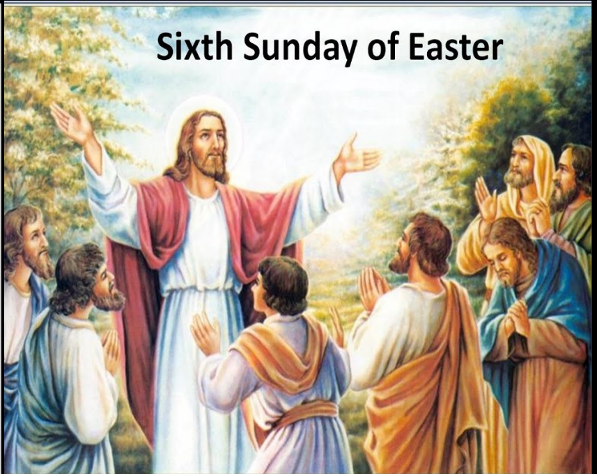
Sixth Sunday of Easter

Por favor traiga el certificado de nacimiento de su hijo a la Rectoría para hacer los arreglos del bautismo. No programamos Bautismos el día Sábado